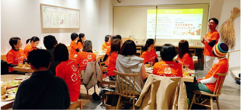
1周年記念イベントの様子。マリモコネクトひろば隣の「まりも食堂」にシェア・コンシェルジュが集結