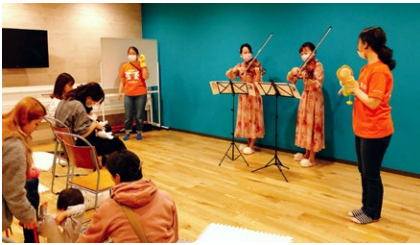
コンサート&バイオリン体験会 in 横浜スタイル倶楽部 (株)日京ホールディングス/神奈川県横浜市