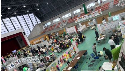
TOBAひだまりフェスタ出展 三重県鳥羽市