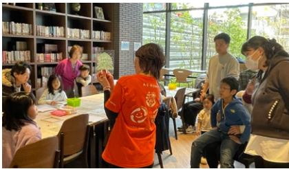
トールペイントWS in シェリアシティ千里山 関電不動産開発(株)/大阪府吹田市