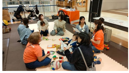
冬のアロマWS in MARK IS 静岡 (株)三菱地所プロパティマネジメント/静岡県静岡市