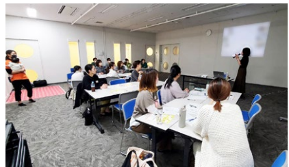
子育て家族のライフプラン勉強会 福岡県北九州市