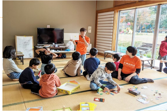
それぞれの得意を活かし、子どもたちと充実した時間に

くみとりつつ、最初の立上げ時から内容の修正を重ねました。現在では週末開催、未就学児も受け入れ可能に変更、預かり時間を昼食も組み込んで長くする等、地域に合う形を試行錯誤しながら、場を育てています。