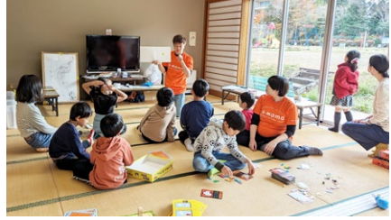
はこねっこ みまもるーむ (箱根町子育てシェアタウン) 神奈川県箱根町