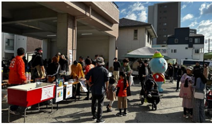
東雲商店会マルシェ出展(マリモコネクト) (株)マリモ/広島県広島市