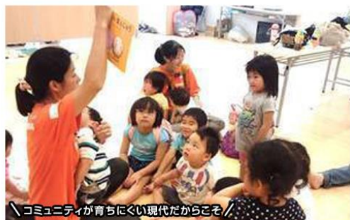
コミュニティづくりを求める声にお応えして