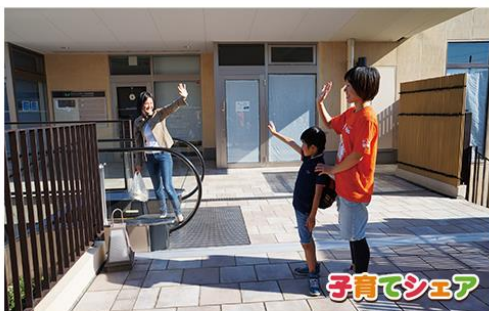
マンション専属のAsMamaママサポーター