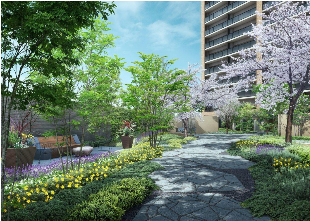
アプローチ完成予想CG

※本資料に掲載の各完成予想CGは、計画段階の設計図面を基に描き起こしたもので、実際とは多少異なる場合がございます。 ※官公庁の指導、施工上の都合等により建物の外観・外構・植栽・仕様・色彩等に変更が生じる場合がございます。 ※植栽は計画段階のものであり、変更になる場合があります。特定の季節、時期を想定して描かれたものではありません。